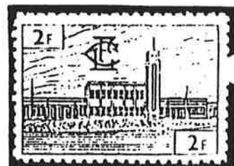
La nouvelle gare de Kabalo Cette gare était le terminus de la liaison ferroviaire entre les réseaux du K.D.L. et du C.F.L. desservant respectivement le Sud et l'Est du Congo